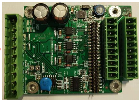
图 2. 功率板