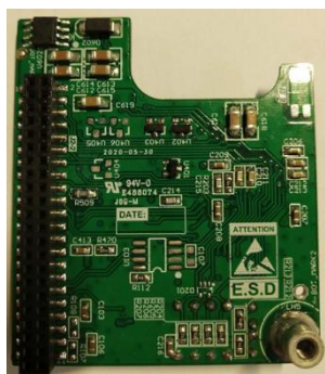
图 1. 控制板