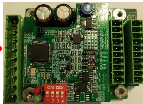
图 3. 组装完成