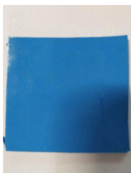
图 4. 导热片厚 2mm